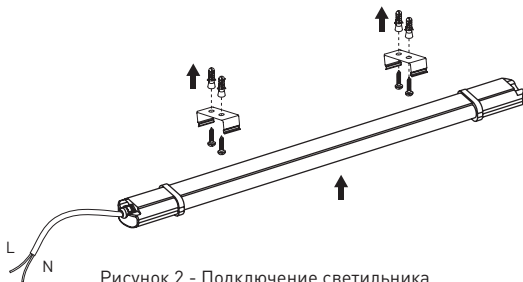
Рисунок 2 - Подключение светильника

5.7 По истечении срока службы светильник утилизировать.